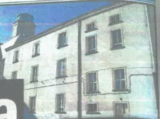
Mieszkania szkoła wynajmuje w swoich dwóch budynkach. Według zasad, powinny być dla osób w złej sytuacji materialnej, które nie posiadają własnego domu.

Dyrektorka poradni podlegającej zagańskiemu Starostwu Powiatowemu wynajęła sobie tanie mieszkanie w powiatowej szkole. Choć ma 150-metrowy dom wart 400 tys. zł i 40-metrowe mieszkanie warte 210 tys. zł. - Czy to zgodne z prawem, bo z etyką chyba nie bardzo? - pyta nasz czytelnik.