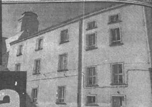
Mieszkanie szkół wynajmuje w swoich dwóch budynkach. Według zasad, powinny być do czasu zmiany sytuacji materialnej, które nie posiadają własnego domu

Dyrektorka poradni podlegającej zagańskiemu Starostwu Powiatowemu wynajęła sobie tanie mieszkanie w powiatowej szkole. Choć ma 150-metrowy dom wart 400 tys. zł i 40-metrowe mieszkanie warte 210 tys. zł. - Czy to zgodne z prawem, bo z etyką chyba nie bardzo? - pyta nasz czytelnik.