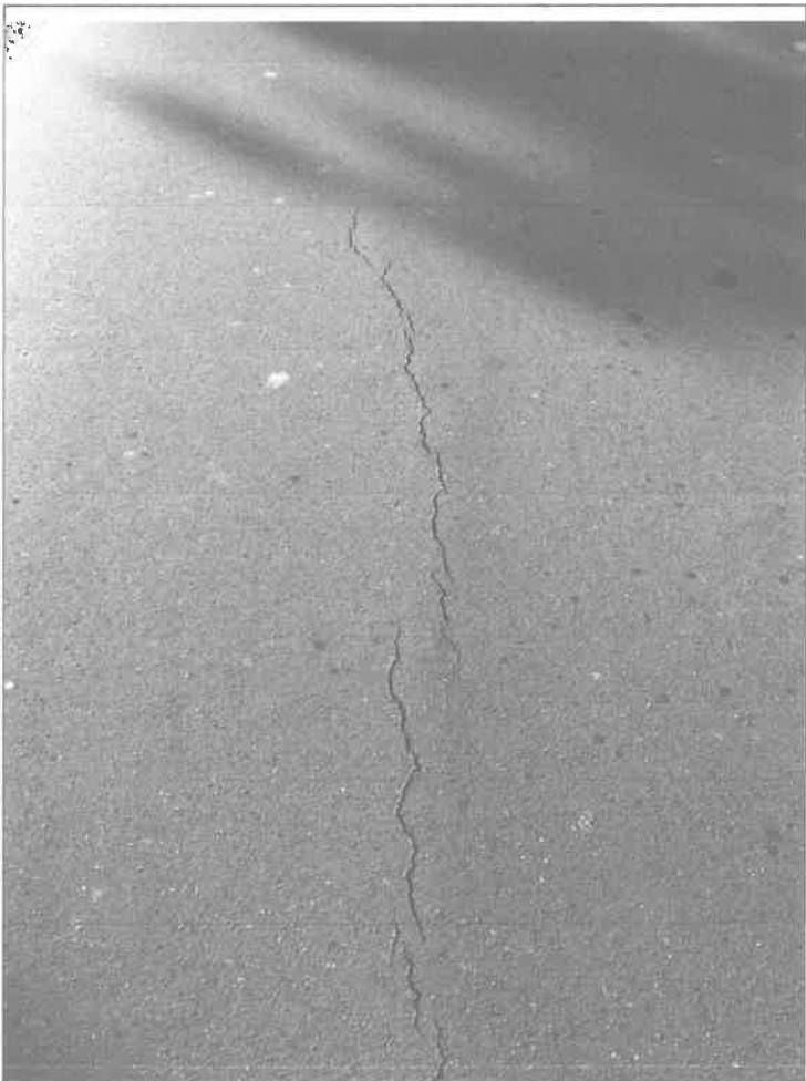
Zesaknowane w CamScanner