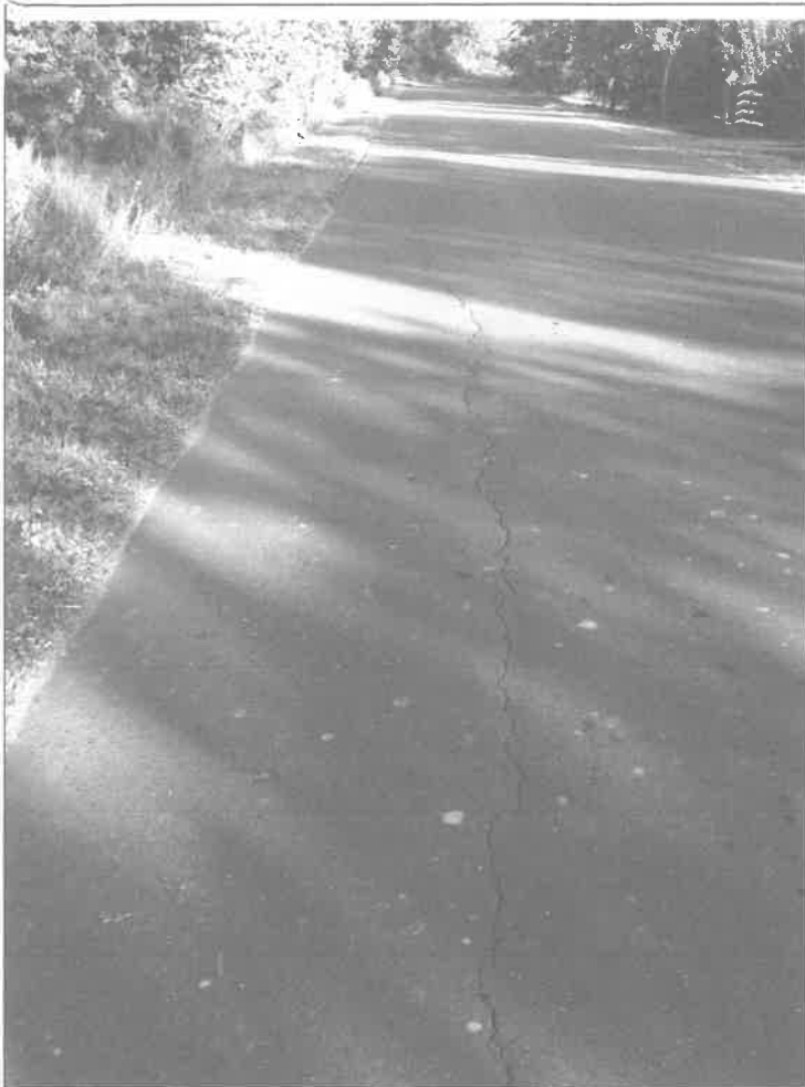
Zesaknowane w CamScanner