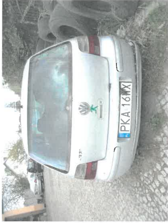
Foto 6 tył pojazdu