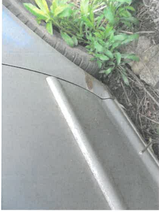
Foto 28 błotnik przedni prawy oraz próg prawy