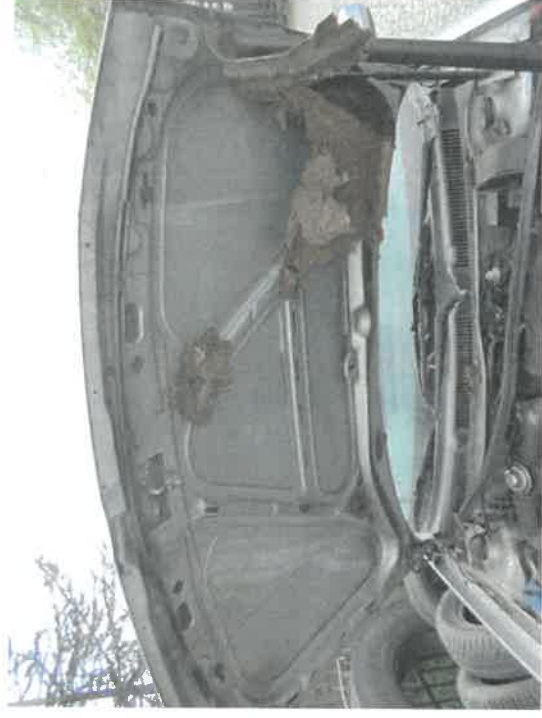
Foto 24- brak wykładziny pokrywy komory silnika

Stowarzyszenie Rzeczników Techniki Samochodowej i Ruchu Drogowego Odział w Zielonej Górze 65-823 Zielona Góra, ul. Olimpijczyka 10 tel. 68 453 56 34, NIP 629 10 10 655