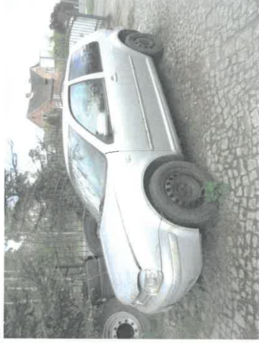
Foto 2-lewy bok