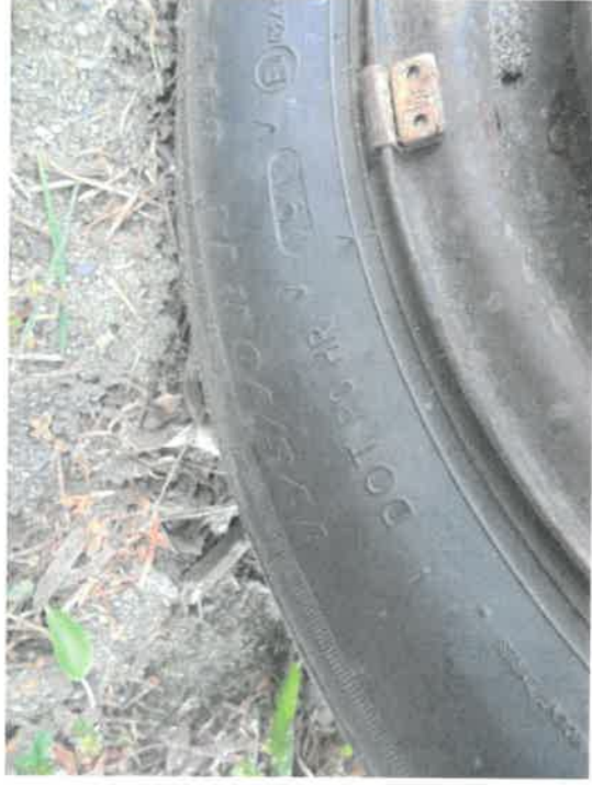
Foto 21- rozmiar oraz oznaczenie opony