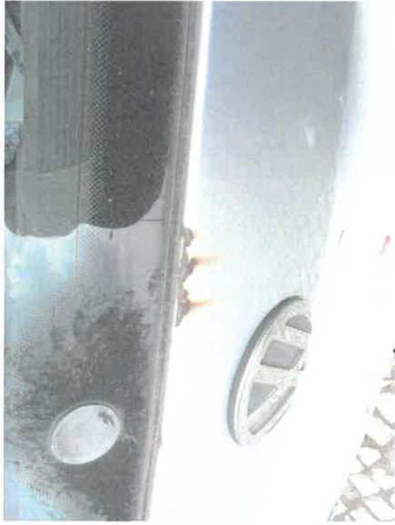
Foto 25 -skorodowana pokrywa komory bagażnika