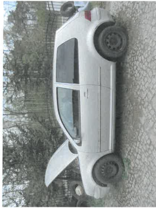
Foto 31- bok lewy