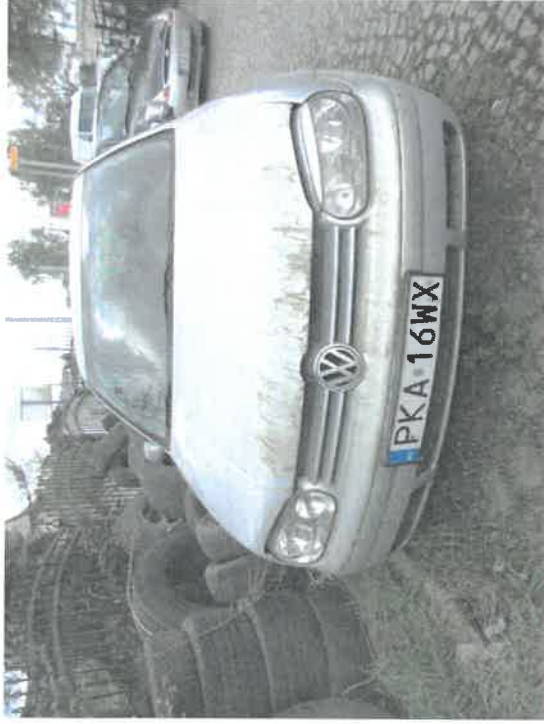
Foto 1- przód