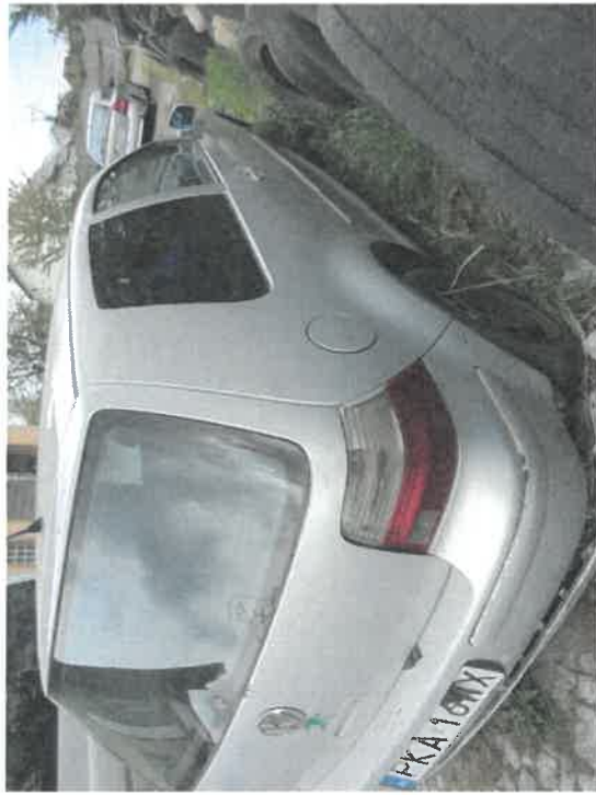
Foto 7 - tył pojazdu z prawej strony